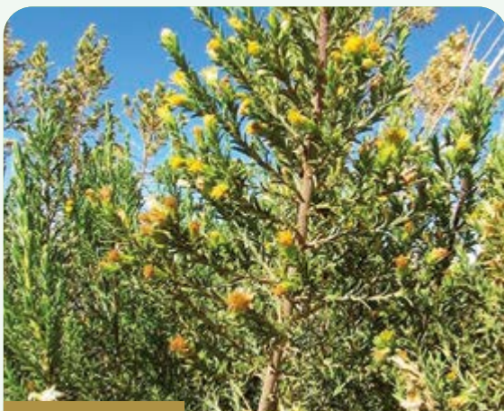
Chillca o Uma t'ola ( Senecio sp)