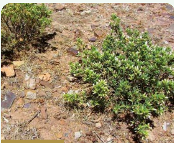
Ñak'a ( Baccharis tola )