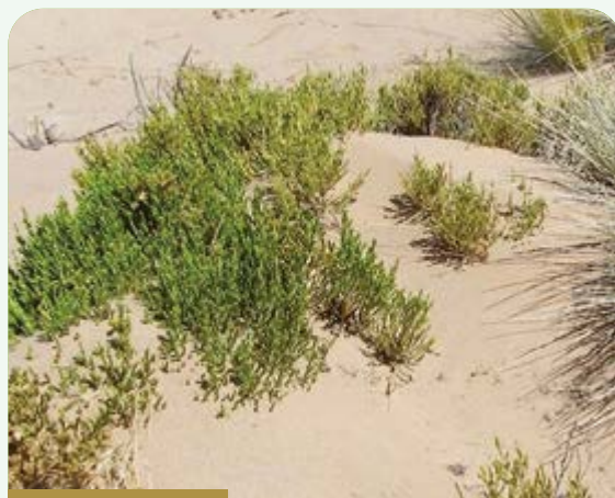
T'i'ti t'ola o Muqu t'ola ( P. lepidophylla )