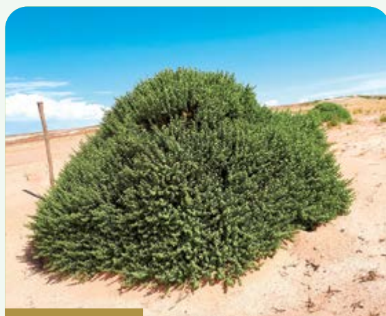
Lamphaya ( Lampaya castellani )