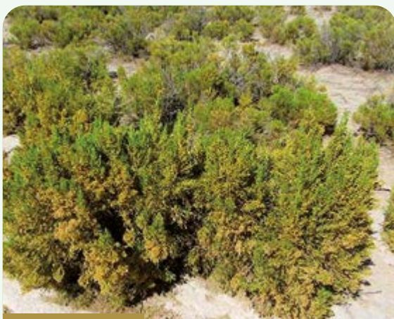
Suphu t'ola o Qhiruta ( Parastrephia lepidophylla )