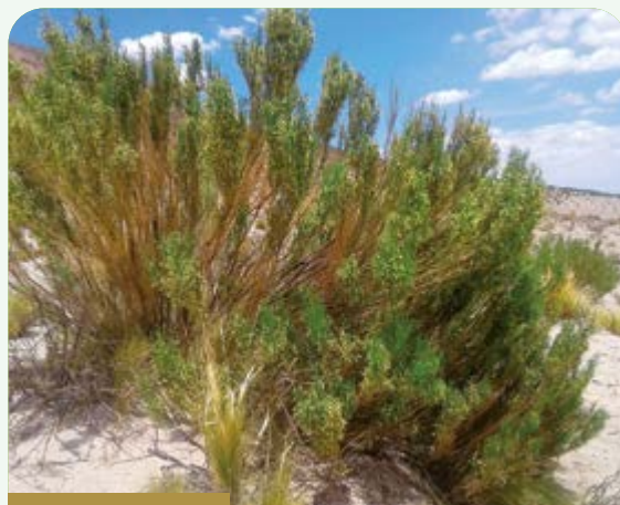
Tara t'ola ( Fabiana densa )